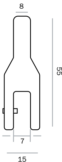
PBDIST32 - Finitura cromo lucido PBDIST32SS - Finitura grigio satinato